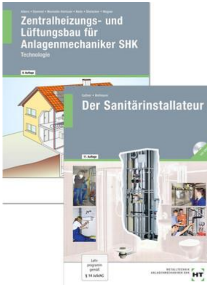
Der Sanitärinstallateur und Zentralheizungs- und Lüftungsbau für Anlagenmechaniker SHK im Schubert (ISBN 978-3-582-03140-2)

Folgende Bücher müssen sich die Auszubildenden besorgen: